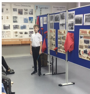
Экскурсия в школьном музее силами юных экскурсоводов 5 «А» класса