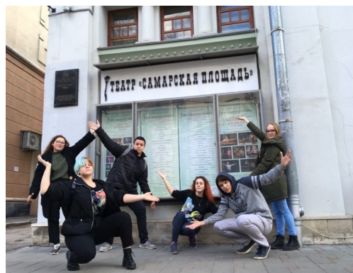
Городская квест-викторина «Театральная Самара» 10 «А» класс