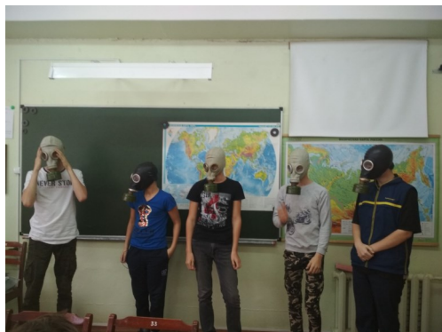
Военно-спортивная игра «Виктория»