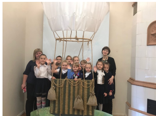
1 «А» класс в музее